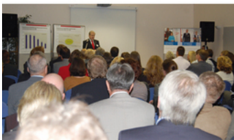
In Vorträgen gab es interessante Informationen

Auf Einladung der Agentur für Arbeit Lübeck kamen über 60 Personalverantwortliche aus Lübeck und Ostholstein im Bugenhagen Berufsbildungswerk Timmendorfer Strand (BBW) zusammen. Bei einer Besichtigung wurden die verschiedenen Ausbildungsbereiche für junge Menschen mit einer Behinderung und die Integrationsarbeit vorgestellt. Derzeit werden dort circa 450 Jugendliche mit Behinderung ausgebildet, 141 von ihnen haben den Status der Schwerbehinderung. Die Jugendlichen kommen dabei aus dem ganzen Bundesgebiet. Die Ausbildungsgänge reichen von der Alten- und Körperpflege, über Bauberufe und Haustechnik, Fahrzeugtechnik, Transport und Recycling, Gartenbau, Agrarwirtschaft und Floristik, Gastronomie, Ernährung, Hauswirtschaft und Textil, Informationstechnologie, Verkauf und Logistik bis zu Wirtschaft und Verwaltung. Der Fokus der Arbeit liegt klar auf einer sich anschließenden Beschäftigung, die im Schnitt bei 60 Prozent der Absolventen gelingt. Dies aber nur, weil das BBW eng mit dem Arbeitgeber-Service sowie über 400 Betrieben zusammenarbeitet, die Menschen mit Handicap gegenüber aufgeschlossen sind und die sich von ihrer Leistungsfähigkeit überzeugen lassen.