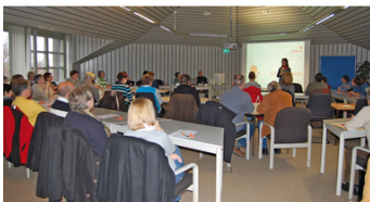
Das Bewerbungstraining stieß auf reges Interesse

Menschen mit einem Handicap haben im Vergleich zu nicht behinderten Menschen größere Schwierigkeiten, auf dem Arbeitsmarkt Fuß zu fassen. Dabei sind sie nicht weniger leistungsfähig, können aber ihre Fähigkeit nicht immer optimal darstellen. Im Rahmen der landesweiten Kampagne „Leistungsstark trotz Handicap“ hat die Agentur für Arbeit Lübeck in Kooperation mit dem Berufsförderungswerk Hamburg (Regionalcenter Lübeck) ein spezielles Bewerbungstraining angeboten.