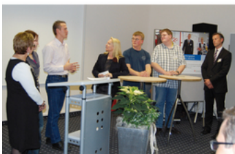
Firmen und Auszubildende berichteten über ihre guten Erfahrungen

In Vorträgen wurden außerdem die Beschäftigungspotenziale vor dem Hintergrund der demografischen Entwicklung und des zukünftigen Fachkräftebedarfes sowie die Vermittlungs- und Unterstützungsmöglichkeiten der Arbeitsagentur aufgezeigt. Ein Arbeitsplatz kann oft schon mit einfachen technischen Mitteln wie Spezialmonitoren oder besonderen Tischen und Stühlen an die individuellen Bedürfnisse angepasst werden. Und in vielen Fällen sind die Behinderungen wie zum Beispiel bei Diabetes gar nicht ersichtlich beziehungsweise stellen keine nennenswerte Einschränkung dar. Die Einstellung von schwerbehinderten Menschen kann die Agentur für Arbeit oder der jeweilige Träger beruflicher Rehabilitation unter bestimmten Voraussetzungen mit Zuschüssen fördern. Allein die Arbeitsagentur Lübeck gibt jährlich rund 10 Millionen Euro für die Teilhabe von behinderten Menschen am Arbeitsleben aus. Seit September 2011 gibt es außerdem die „Initiative Inklusion“ des Bundesministeriums für Arbeit und Soziales, mit der mehr Ausbildung und Beschäftigung auf dem allgemeinen Arbeitsmarkt erreicht werden soll.