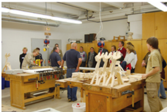
In der Tischlerei konnte z.B. die Ausbildung zum Holzbearbeiter kennengelernt werden

Eine auf dem Arbeitsmarkt bisher kaum wahrgenommene Personengruppe sind arbeitssuchende Menschen mit einer Behinderung. Um aufzuzeigen, dass schwerbehinderte Menschen genauso einsatzfähig sein können wie Mitarbeiter ohne Einschränkungen, wurde vom 07. November bis 11. November 2011 eine landesweite Kampagne „Leistungsstark trotz Handicap“ durchgeführt.