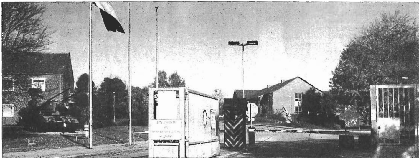
Nach 50 Jahren Bundeswehr in Lütjenburg droht der Schill-Kaserne die Schließung.